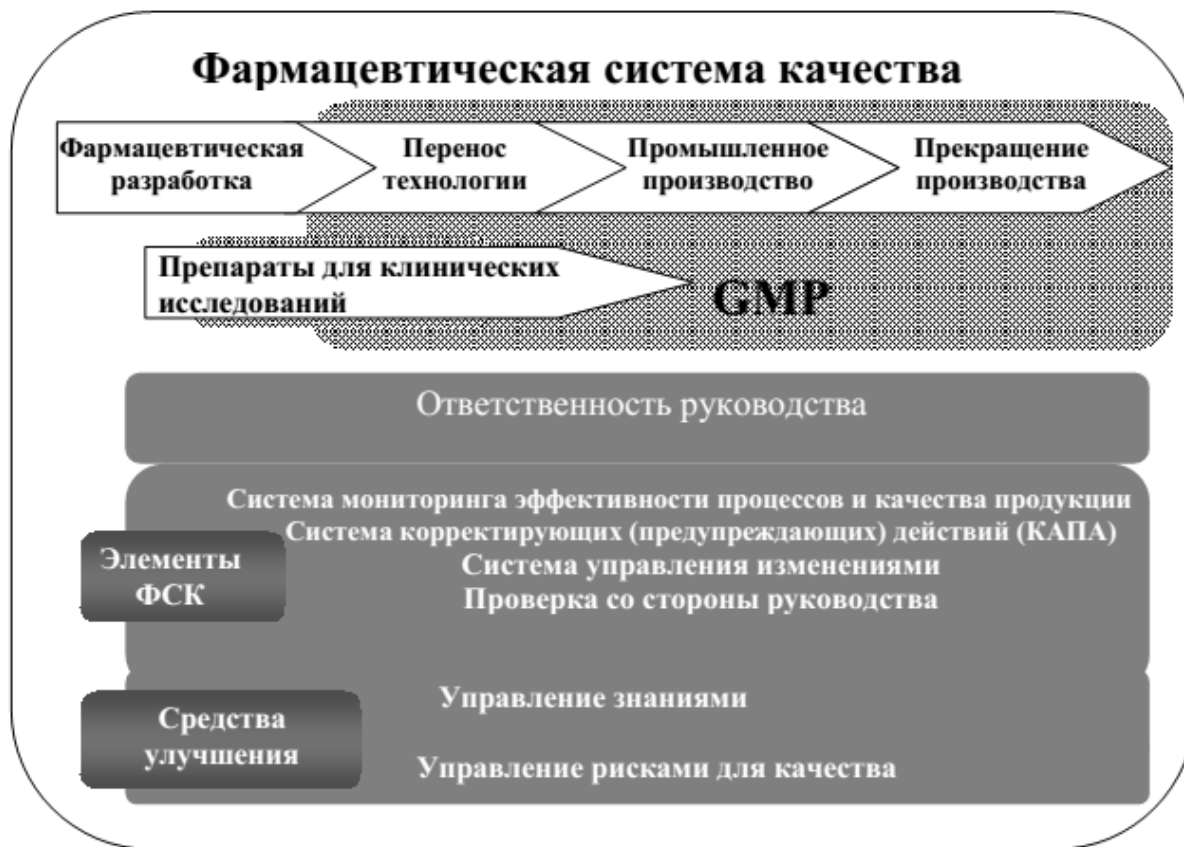
СХЕМА модели фармацевтической системы качества

На схеме показаны основные особенности модели фармацевтической системы качества (далее – ФСК). ФСК охватывает весь жизненный цикл продукции, включая фармацевтическую разработку, перенос технологии, промышленное производство и прекращение производства.