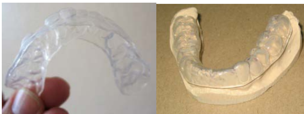
Рисунок 1. Готовая шина

Методика изготовления релаксационной шины: получение оттисков верхнего или нижнего зубного ряда, отливка моделей, выравнивание цоколя модели по вертикали гипсовым ножом или обрезка моделей. В устройстве «Вакуум-формер», используя пластину толщиной 1,5–2 мм, прессуют форму модели челюсти. Производят обрезку шины ниже на 1–2 мм от шейки зубов, как показано на рис.1, 2.