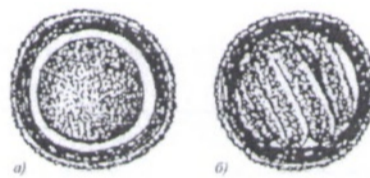
Рис. 8. Яйца аскариды собачьей (токсокары) а) на начальной стадии развития; б) инвазионное