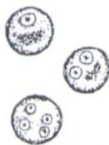
Рис. 4. Цисты амёбы дзентерии