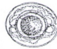
Рис. 10. Яйцо цесты карликового