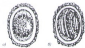
Рис. 5. Яйца аскариды человеческой (свиной): а) оплодотворенное; б) незатопленное