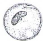
Рис. 3. Циста балантидия кишечного