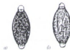
Рис. 7. Яйца фасциолы а) свежесыроечное; б) инвазионное