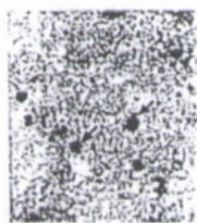
Рис. 1. Ооцисты криптоспоридии (окраска по Цилю – Нильсену)