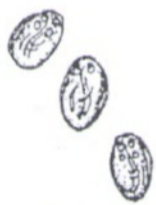
Рис. 2. Цисты лямблий